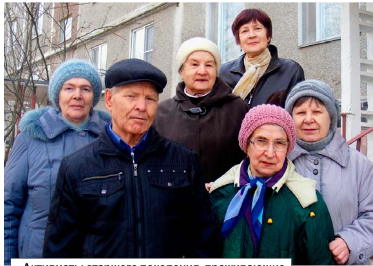
Активисты старшего поколения, проживающие в доме №25 по улице Энтузиастов

В нашем доме находится нежи-лое помещение, в котором распо-ложен магазин. Его арендато-ры облагородили территорию вокруг и посадили декоративные растения. Работники этой торго-вой точки постоянно следят за чистотой и порядком. «Мир станов-ится чуточку краше!» - радуют-