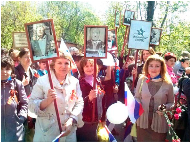
Педагоги Мушковичской школы, учащиеся и их родители вместе с другими ярцевчанами приняли участие в акции «Бессмертный полк», которая проходила в Ярцево. Мушковичцы несли портреты ветеранов войны, проживавших в сельском поселении. После акции портреты ветеранов дополнили экспонаты школьного музея.