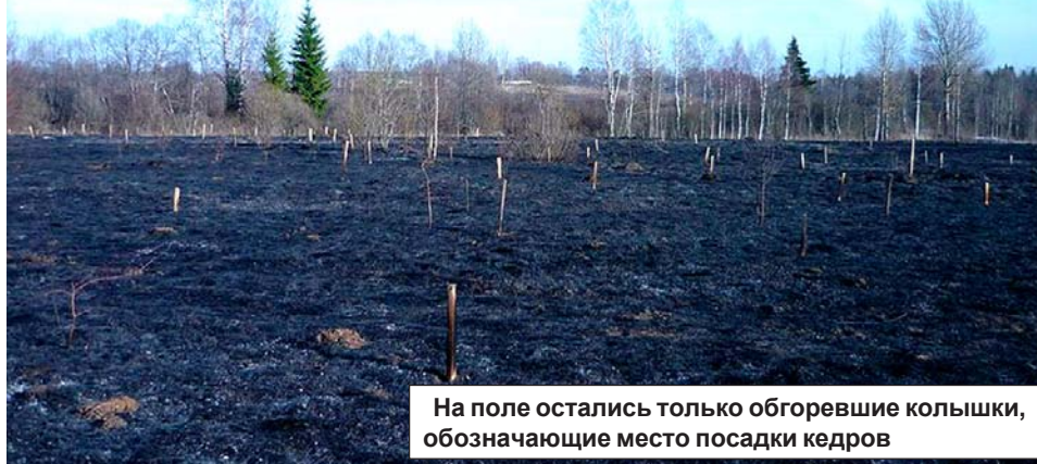
На поле остались только обгоревшие колышки, обозначающие место посадки кедр

Осенью прошлого года на здешних полях было высажено около тысячи молодых кедр, большая часть которых сгорела из-за халатности по отношению к живой природе. Об опасности пала сухой травы по два раза в год через СМИ граждан предупреждают как природоохранные, так и противопожарные службы. Но траву жгут каждый год, причем преднамеренно.