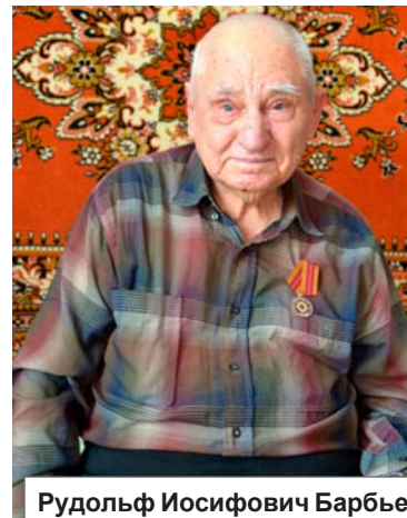
Рудольф Иосифович Барбье